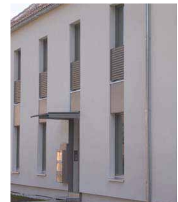
Ansicht Putzfassade Nordseite